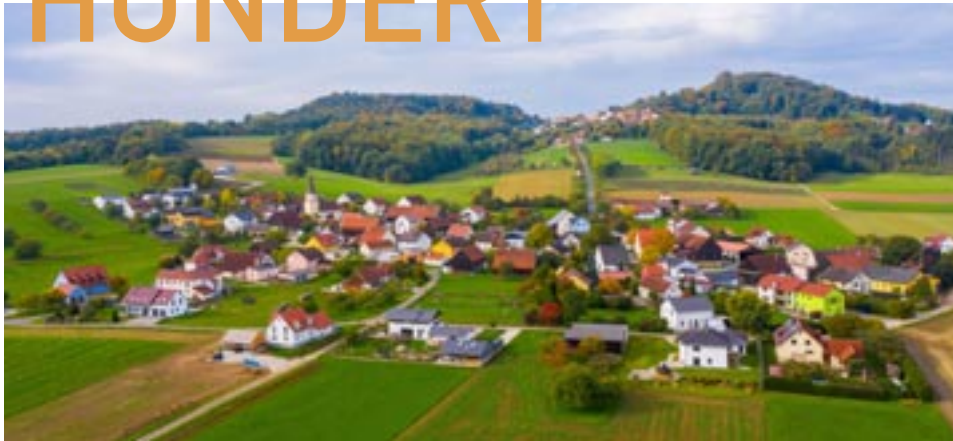
Hofen heute – Luftaufnahme auf Hofen und Sulzbürg

100 Jahre LKG Hofen! Wir wollen dieses runde Jubiläum als Anlass nehmen, dankbar zurück zu blicken auf die 100 Jahre Geschichte unserer Gemeinde. Wir wollen darüber nachdenken, was hat die Menschen damals bewogen die landeskirchliche Gemeinschaft zu gründen? Wir wollen uns aber auch bewusst